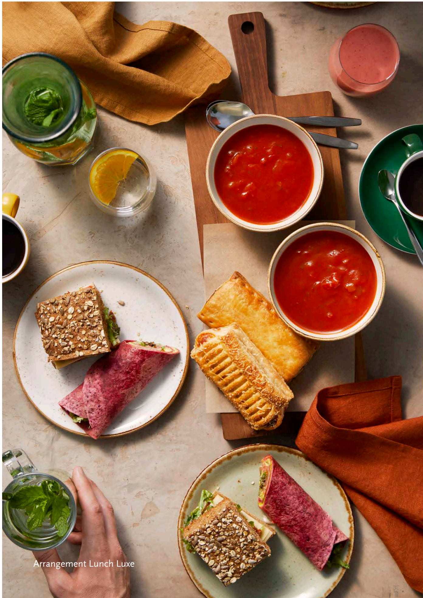
Arrangement Lunch Luxe