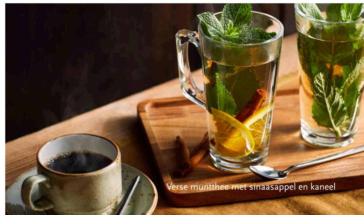
Verse muntthee met sinaasappel en kaneel