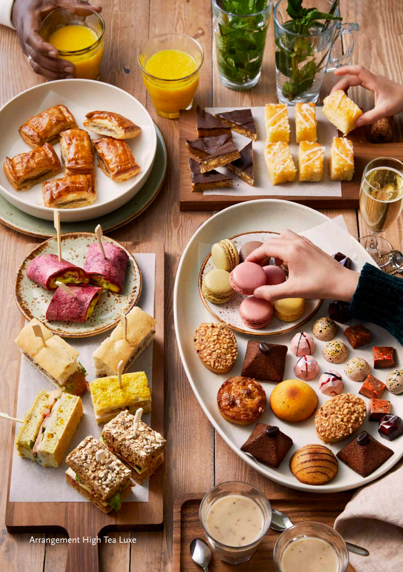
Arrangement High Tea Luxe