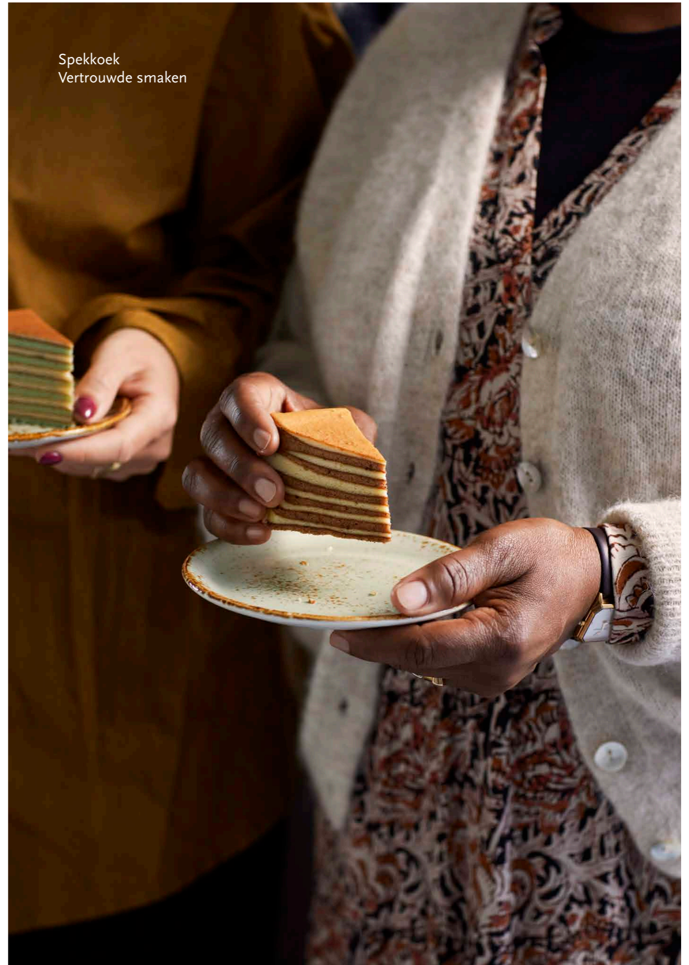
Spekkoek Vertrouwde smaken