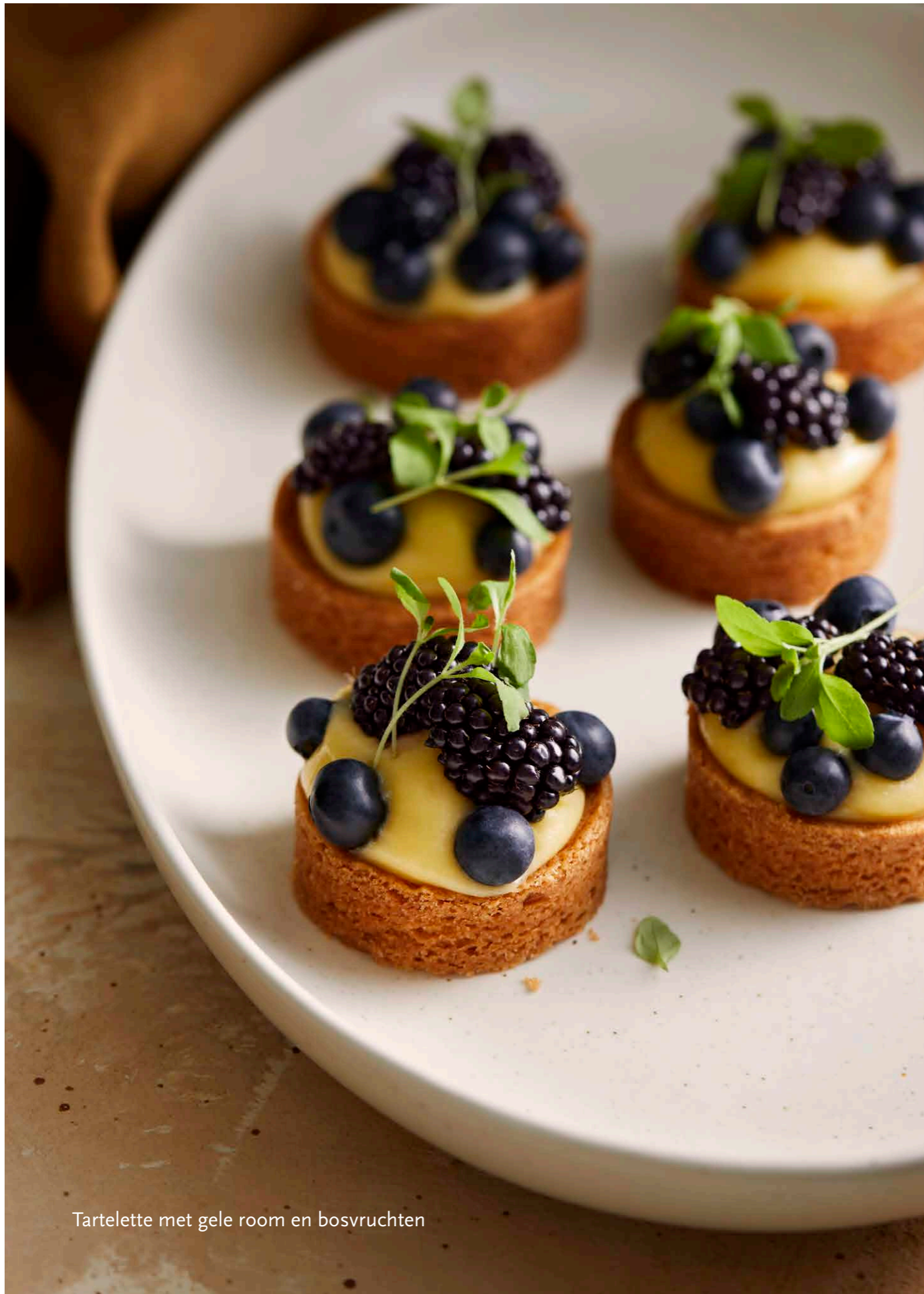
Tartelette met gele room en bosvruchten